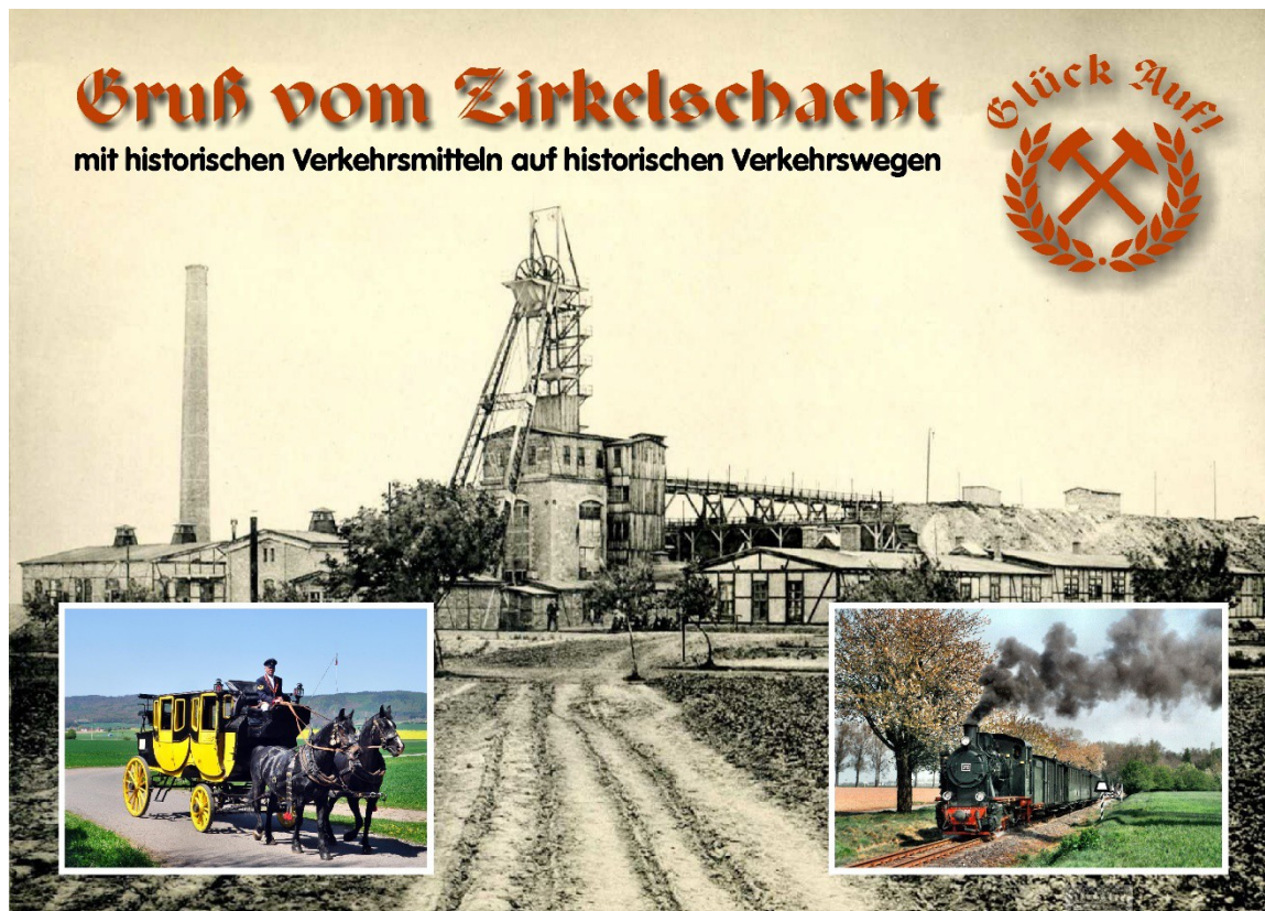
Limitierte Ansichtskarte „Gruß vom Zirkelschacht“